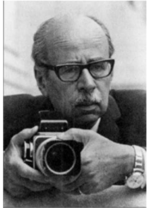
פיליפ האלסמאן אין די שפעטערע יארן

“די סיבות פון די מלחמות”, און נאך אנדערע. ער פלעגט אָבער זיין אָפּגעהיט זיי צו פאַרעפנטלעכן אין צייטן, אין וועלכע עס האָט געדראָט אַ געפאַר, אַז דער פּסיכאָנאָליז זאָל פאַרווערט ווערן. דאָס איז דער הויפט־מאָטיוו, צוליב וועלכן ער האָט זיך אָפּגעהאַלטן צו לאָזן אין דרוק די דריטע און וויכטיקסטע טייל פון זיין לעצט ווערק “משה און דער מאָנאָטעאיזם”. אין 1939, זייענדיק אין לאַנדאָן, האָט ער געדרוקט דאָס בוך, וואָס ער האָט געהאַט פאַרענדיקט מיט פינף יאָר פריער. דער כוח איינצוהאַלטן זיין כעס האָט אים אָפּגעהאַלטן אַריינצופאַלן אין צאָרן. דאָס האָט ער געהאַט געטאָן נאָך אין יאָר 1913, ווען זיינע שווייצאַרישע תלמידים מיט קאַרל יונגן בראש האָבן אים פאַרלאָזט. אין יענער צייט האָט ער אָנגעשריבן זיין קאָמענטאַר וועגן מיקעלאַנדזשעלאָס “משה”. אין דער סקולפּטור האָט ער געזען דעם תנ”ך־העלד