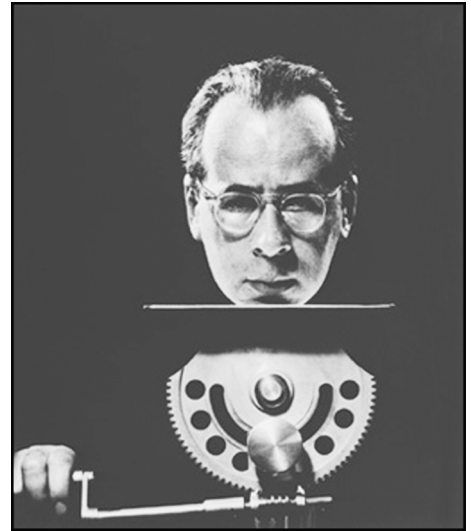
דער באַקאַנטער פֿאַטאָגראַפֿישער אויטאָפֿאַרטעט פֿון פֿיליפּ האַלסמאַן "מיט אַן אָפּגעזונדערטן קאָפּ"

עס איז מערקווירדיק דער פֿאַקט, וואָס אַט דער אַרטיקל ווערט נישט דערמאָנט אין אַזעלכע וויכטיקע פּרויד־ביאָגראַפֿיעס, ווי די פֿאַרפֿאַסער פֿון פֿיטער גיי און עמיליאַ ראַדריגע. עס איז מיר נישט באַקאַנט קיין